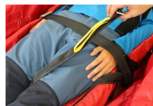
Beinschlaufe unter dem Bein durchführen und über dem Bein zurück zur Gurtschnalle