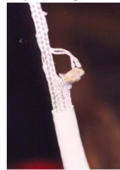
Colours in the picture inverted for better visibility