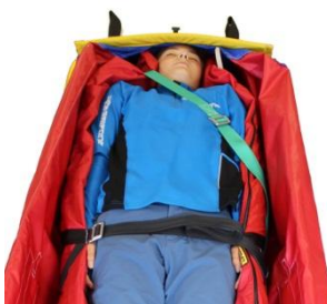
Hüftgurt und 1. Schultergurt