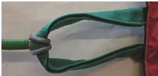
Strang mit flachem Knoten befestigen.